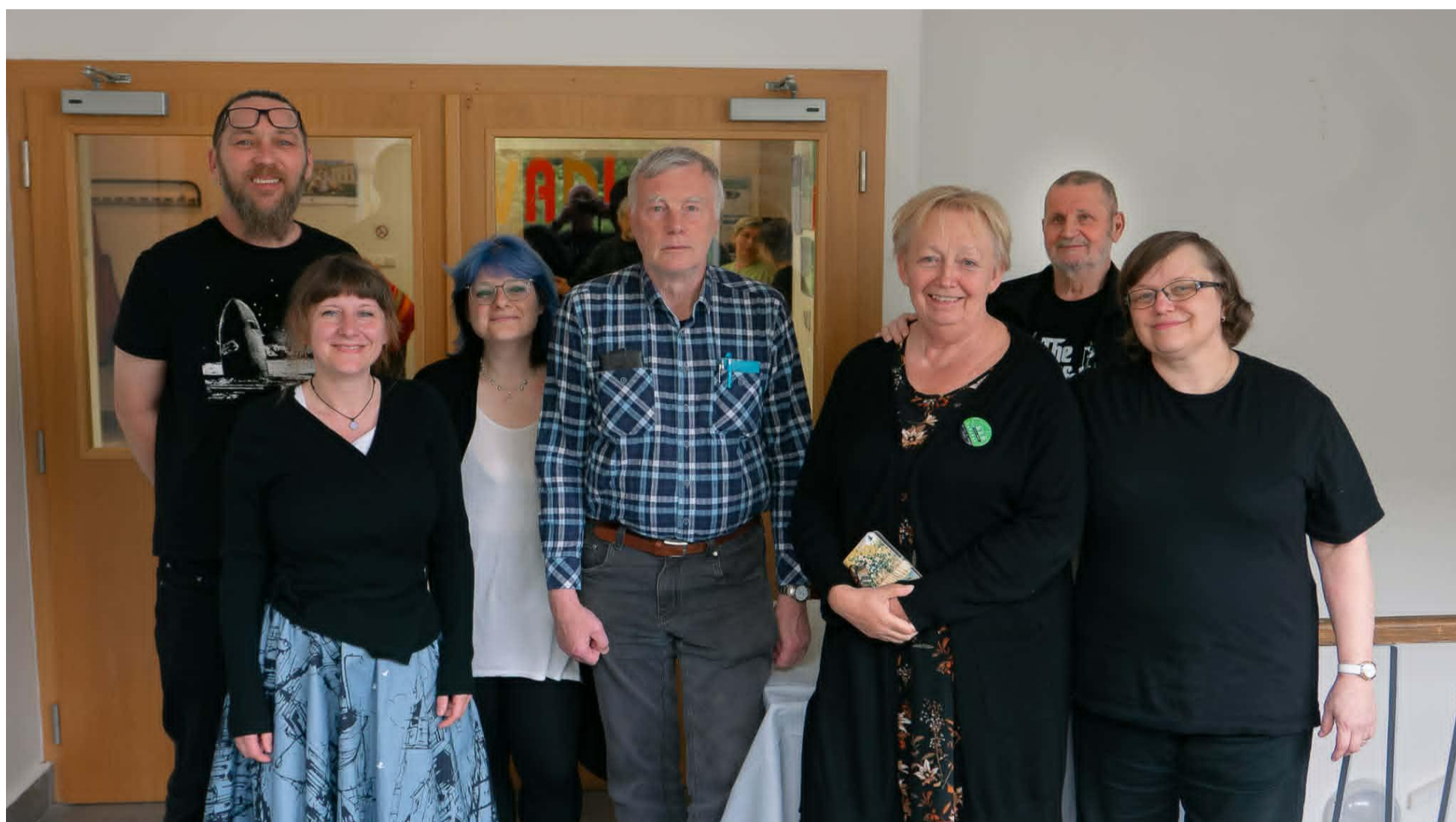
Tak na počtenou zase za rok!